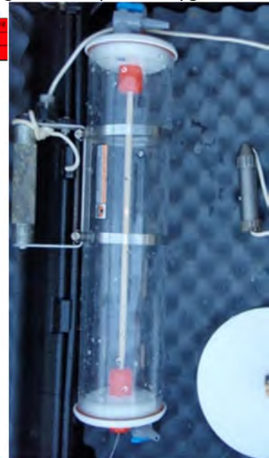
Vassprøvetakar for uttak av nærings salt og miljøgift prøvar frå sjøvatn

Ta kontakt for tilbud på måling og prøvetaking!