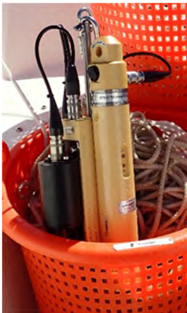
SD204 CTD frå SAIV AS

Vår SD204 CTD frå SAIV måler salinitet, temperatur, alger og oksygen med optisk oksygensonde